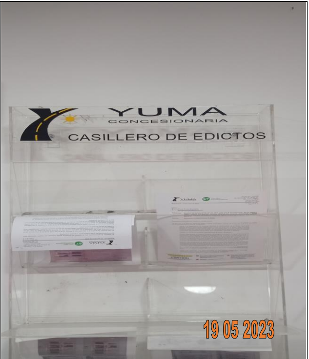
EDICTO P_07909 YC-CRT-127190