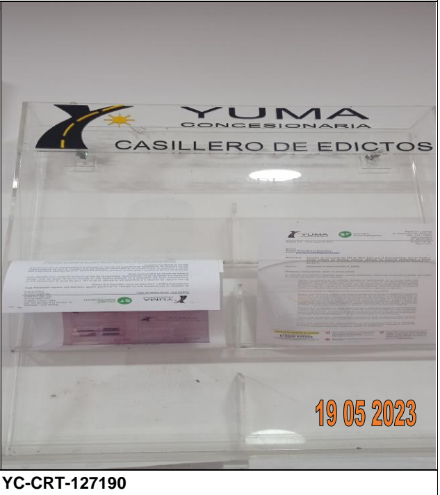
EDICTO P_07909 YC-CRT-127190